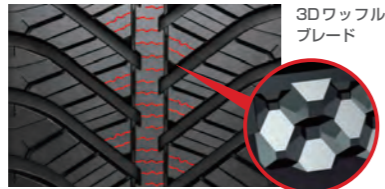
センターエリアのサイブ側面にワッフル状の凹凸を形成。ブロック間が支えあい、高い剛性を生み出します。

高い剛性を生み出す3Dワッフルブレードにより、路面を選ばず優れた運動性能を実現。